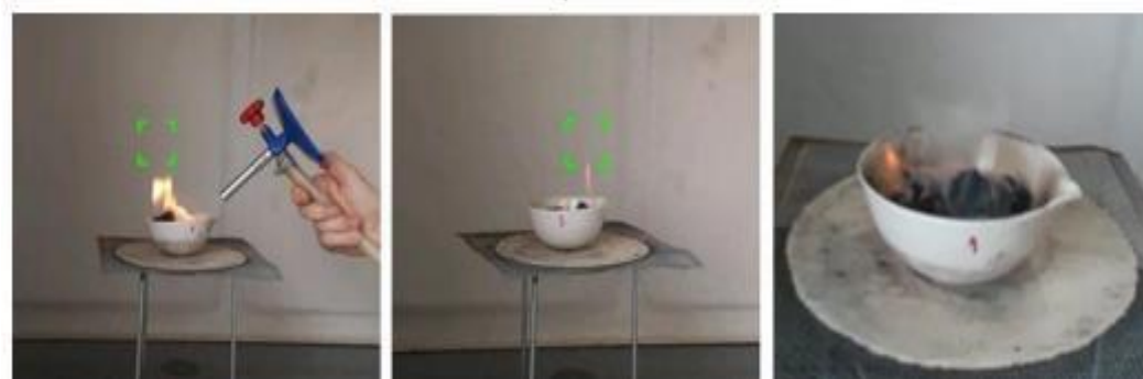
Figura 3: Queima de biocombustíveis sólidos, Amostra 3 confeccionados com biomassa de 100 g de casca de batata inglesa e 70 g borra de café.