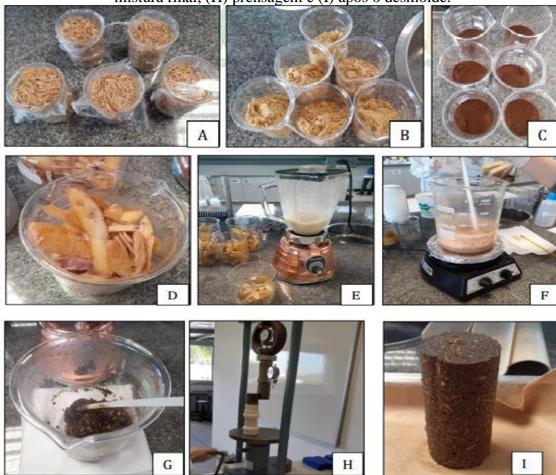
Figura 1: Preparação dos briquetes, sendo (A) casca de arroz, (B) casca de laranja, (C) borra de café, (D) casca de batata, (E) moagem da casca de batata, (F) aquecimento e mistura, (G) mistura final, (H) prensagem e (I) após o desmolde.