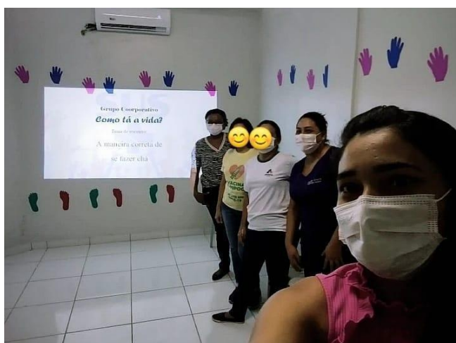
Figura 2. Oficina “A maneira correta de se fazer chá”.

Tal esforço cooperativo requer, por parte do grupo, aceitação e respeito por seus participantes individuais, assim como por parte de quem organiza o grupo. O (a) usuário (a) que recebe o cuidado está inserido no sistema de saúde, necessitando de linhas de cuidados de diferentes tecnologias, que por muitas vezes não são acessíveis. Isso muitas vezes decorrentes de burocracias acompanhadas de um atendimento nada acolhedor, informações desconstruídas, encaminhamentos, falta de humanização com o (a) usuário (a). Para que as dificuldades mencionadas acima sejam modificadas, Meireles e Andrade (2019) mencionam a importância de grupos na Atenção Básica.