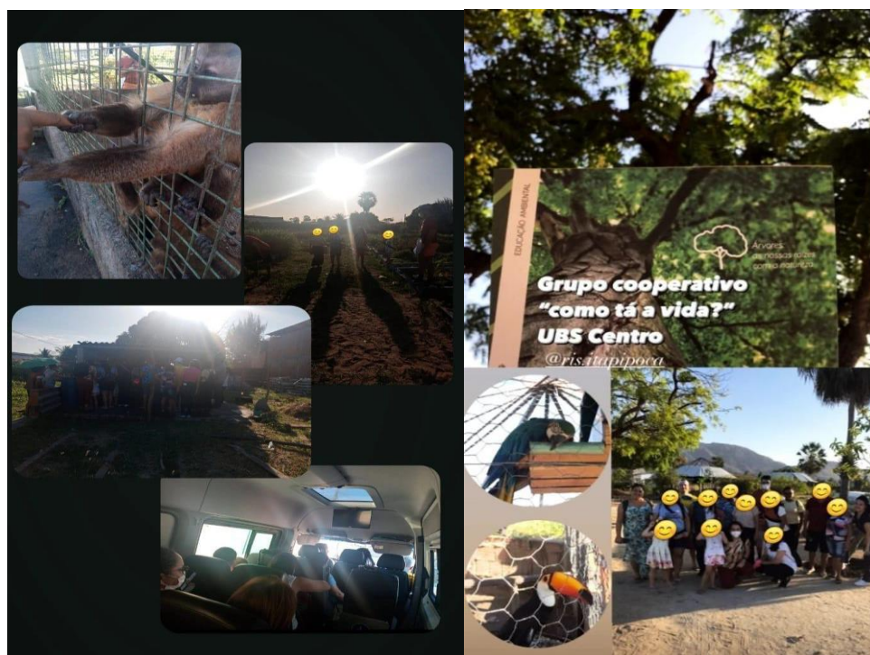
Figura 4 e 5. Passeio a Horta viva