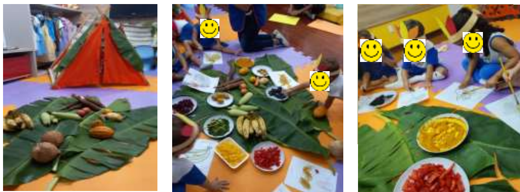
Figura 6: comendo com os índios

Ainda foi realizado a oficina comendo com os índios (Figura 6), nessa atividade foi realizado a integração entre ser gostoso e ainda colorir a saúde, os alunos escolhiam uma imagem para colorir com os alimentos, foram usados: pimentão vermelho, espinafre, beterraba, pimentão amarelo e açafrão. Além disso, foram mostrados alguns alimentos consumidos pelos índios e na observação e análise do recordatório foi possível constatar a interação de alguns alunos pela primeira vez.