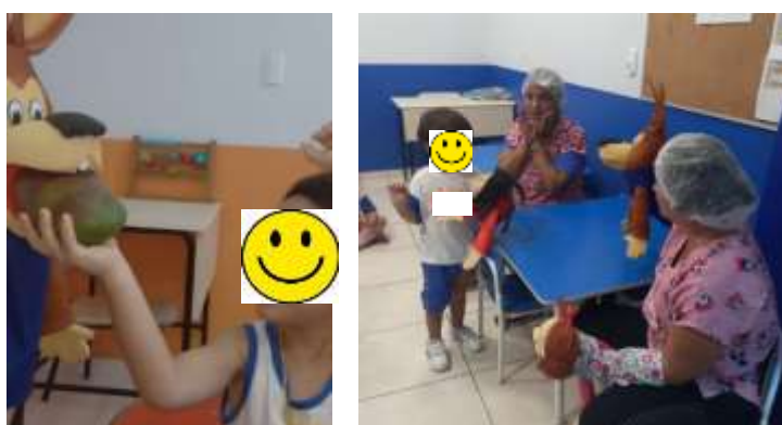
Figura 2: Oficina de contação de história: Chapeuzinho vermelho e o lobo amigo das frutas.

Na oficina Chapeuzinho Vermelho e lobo amigos das frutas (Figura 2), o recurso de contação de história foi usado para inserir situações de hábitos alimentares e permitiu a participação dos alunos no desenrolar do conto.