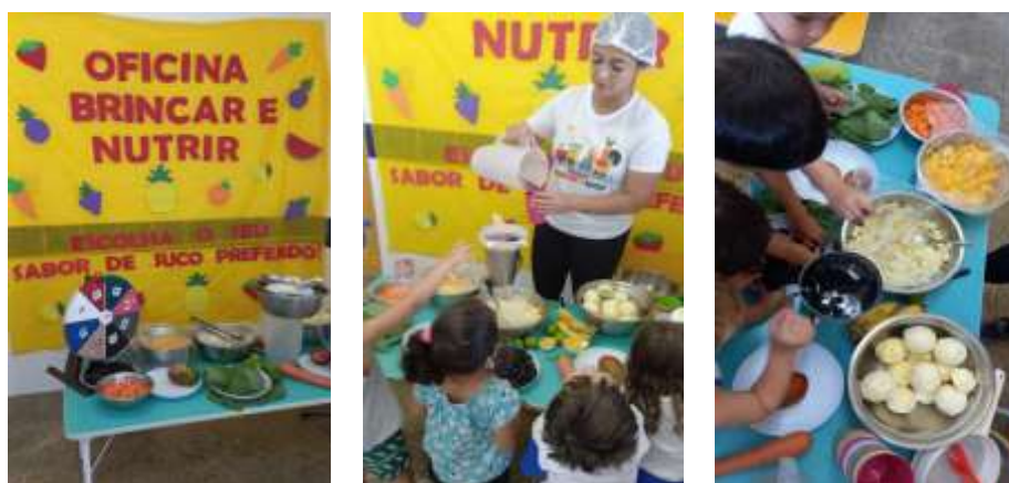
Figura 4: Oficina roleta das cores

Já a oficina roleta das cores (Figura 4), foi preparada com o intuito de brincar com as cores e sua associação com as frutas e o preparo de sucos com a escolha das frutas preferidas a fim incentivar além da interação, o interesse em provar o suco das cores.