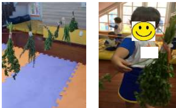
Figura 3: oficina varal de temperos

A segunda oficina desenvolvida foi o varal de temperos (Figura 3), realizada buscando a avaliação do comportamento frente aos estímulos sensoriais do toque e do cheiro, associados a curiosidade de querer experimentar.