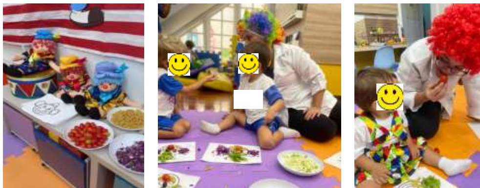
Figura 5: oficina circo dos alimentos

Nessa oficina os alunos já estavam mais interativos com o alimento e rapidamente interagiram com a atividade, alguns alunos que possuíam seletividade alimentar romperam algumas barreiras e chegaram a cheirar alguns alimentos, amassar e levar a boca outros. Alguns alunos comeram uvas e tomates pela primeira vez, mostrando que a observação, o incentivo e a repetição do comportamento do outro frente aos alimentos funciona como ferramenta de educação alimentar e nutricional.