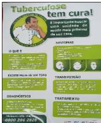
Figura 1. Panfleto informativo sobre a Tuberculose.