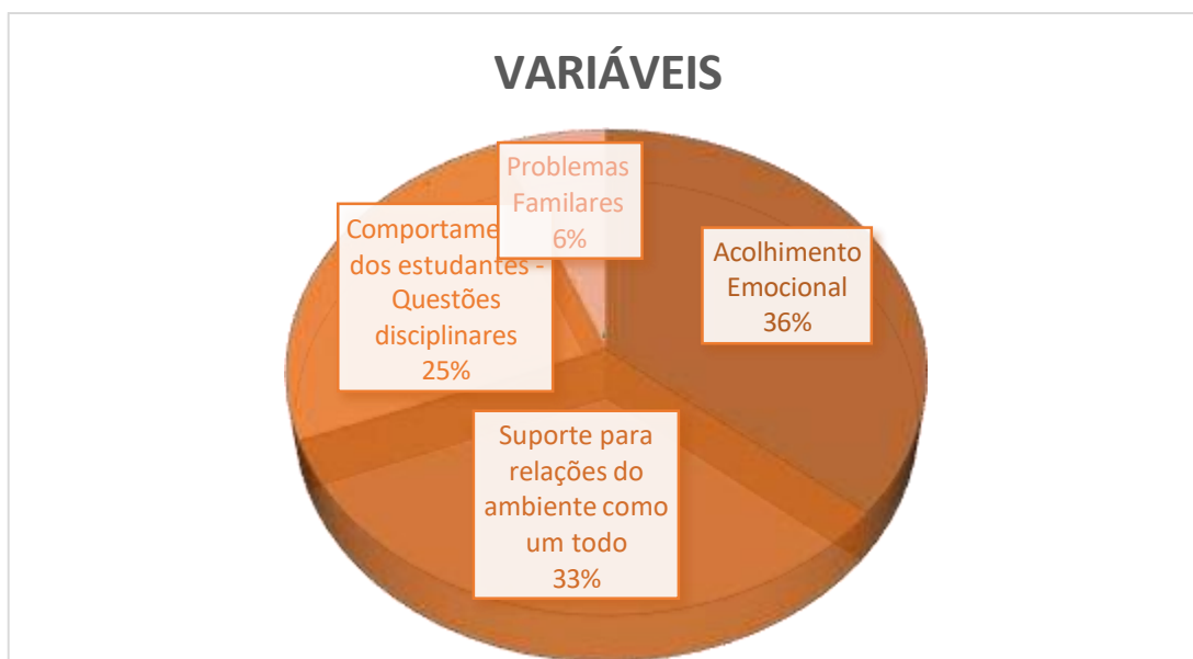
Imagem 1: Papel do psicólogo escolar segundo professores.